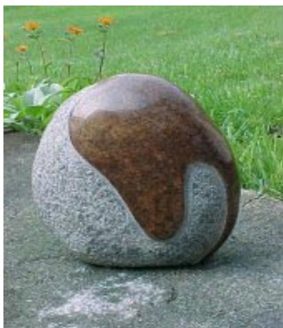
„Fanten“ er færdig