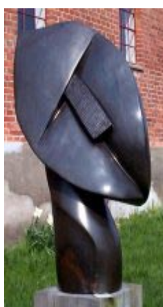
Skulpturer fra Farm Of Art www.Farm-of-art.dk