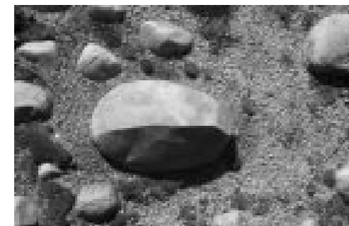
Vindslebne sten i haven