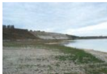
Fra tidligere besøg i Rørdal