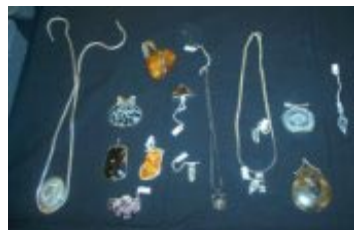
Smykkeudstilling fra Åbent Hus