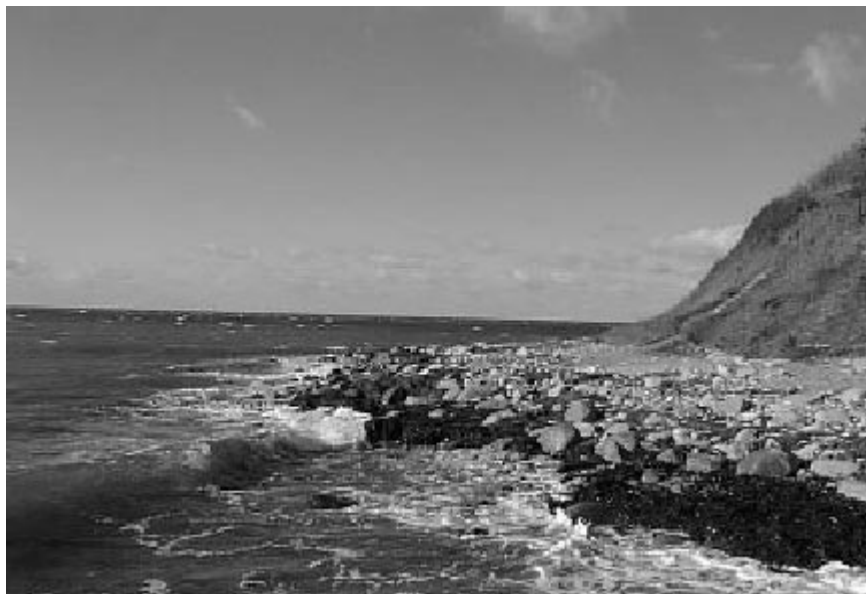
Parti fra Gedser Odde

Gedser Odde: Fra Gedser kan man gå langs stranden til både fyret og Gedser Odde - eller man kan vælge at tage bilen. Gedser Oddes natur er noget helt specielt. Mod syd kan der være stille og roligt, mens stormen pisker 'lige om hjørnet', hvor havet også er i fuld gang med at æde løs af lerklinten.