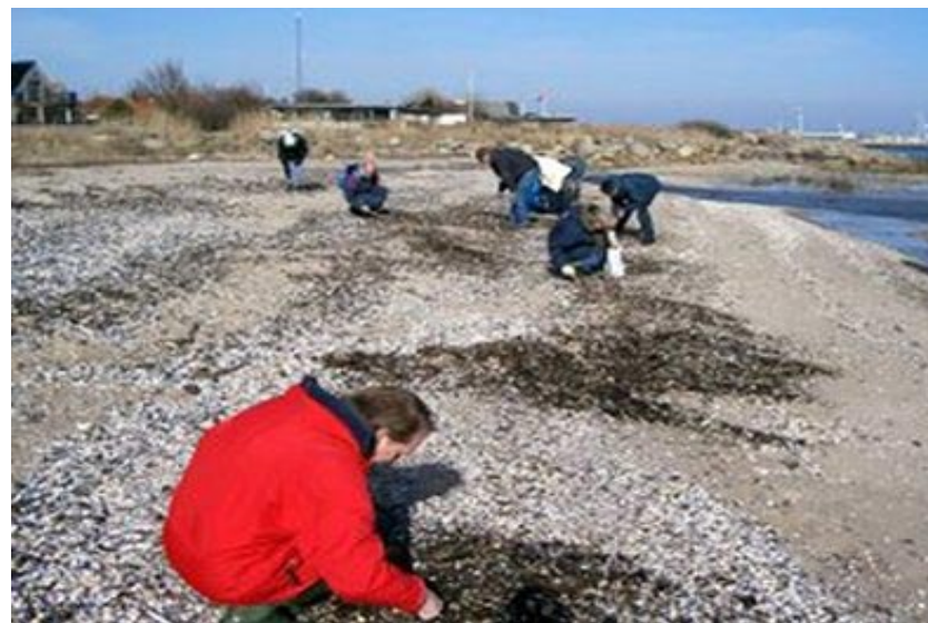
Efter generalforsamlingen tog medlemmerne i strålende solskin ud på årets første uden-dørs aktivitet. Turen gik til stranden ved Bangsbo, hvor der blev fundet rav.