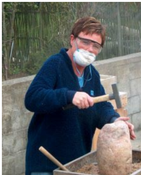
Helle hugger sten