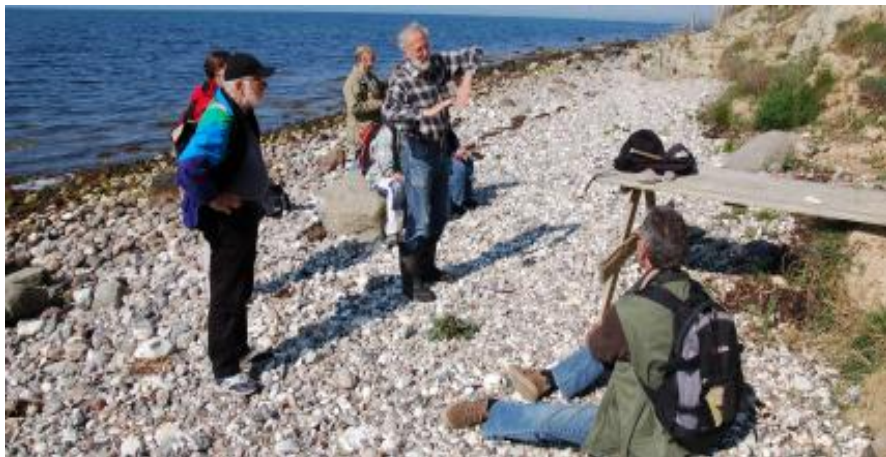
Der forklares om istidernes påvirkning af klinten