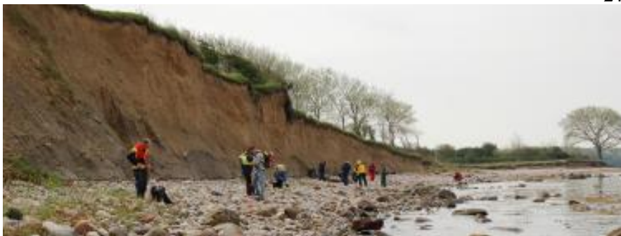
Parti fra Frankeklint, Langeland