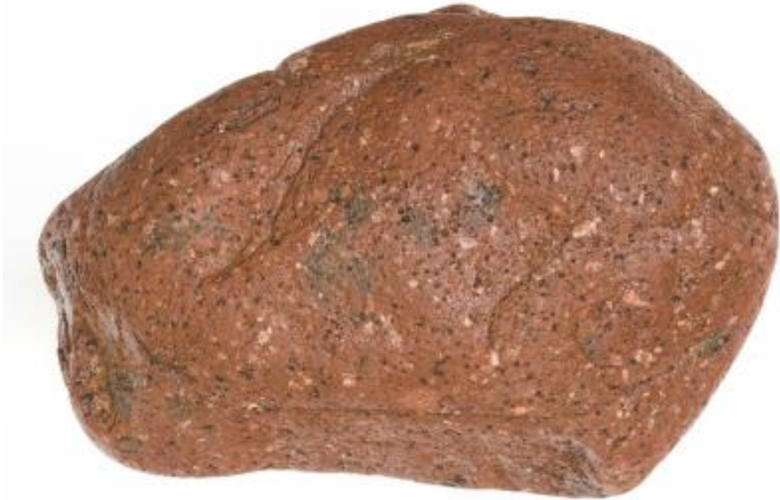
Brun Østersø-kvartsporfyrr med xenolither, 16 cm

Brun østersøkvartsporfyrr er den dominerende østersøblok i størstedelen af landet. Af undtagelser kan nævnes Kalø Vig og ”de røde klinger” på Hinds-holm, hvor den røde Østersø-kvartsporfyrr findes i hobetal i selskab med Ålandsblokke, samt Limfjordsområdet og Vendsyssel, hvor de røde typer er mere almindelige end de brune.