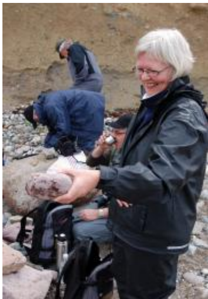
Et tilfredsstillende fund