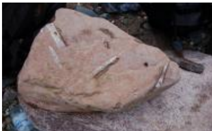
Orthoceratit fundet ved Frankeklint