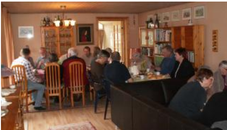
Generalforsamling under hyggelige former.