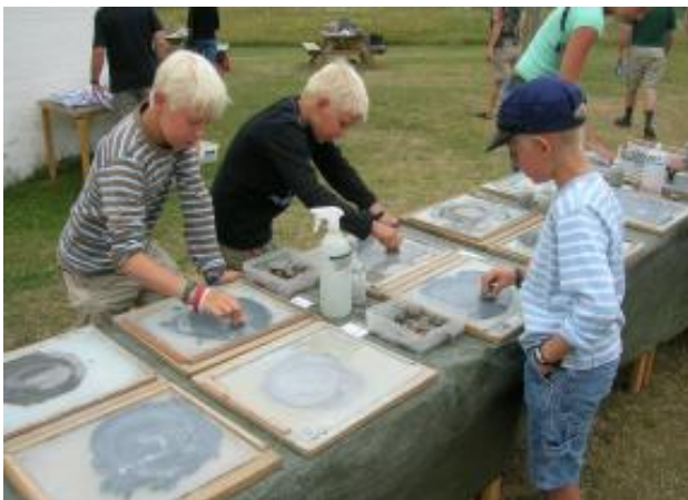
Stor aktivitet med stenslibning på Strandfogedgården

gerne have en melding fra dig på telf. 9818 5366. Selv få timer vil være en stor hjælp og vil aflaste de stenklubfolk, som allerede har givet tilsagn om deltagelse.