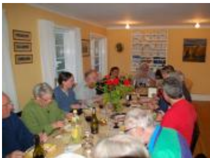
Der hygges på pension Damgården