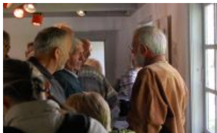
Stor spørgelyst på Henriks udstilling