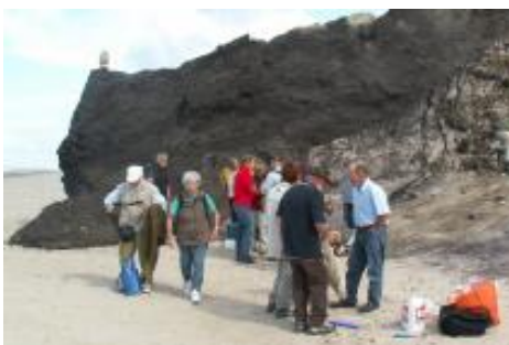
Ved klinten i Lodbjerg