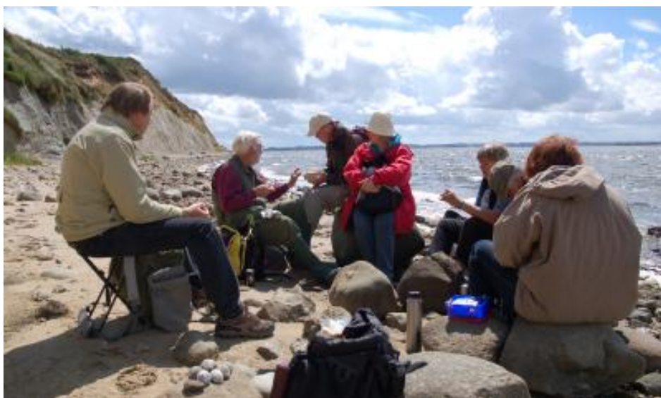
Frokostpause på Melbjerg Hoved