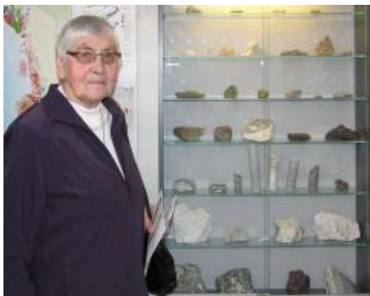
Edith i Det Grønlandske Hus

GEUS har sponseret et detaljeret geologisk kort, og sammen med en folder med billeder af udstillingsemnerne og en kortfattet introduktion har man nu god mulighed for at danne sig et indtryk af Grønlands geologiske alsidighed.