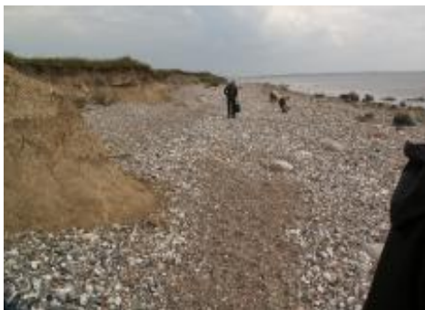
Parti fra vestsiden

Jeg tror, alle var velforsynede og glade for at have set eller guset denne perle af en ø, og det bliver helt sikkert ikke sidste gang, klubben vælger den som turmål.