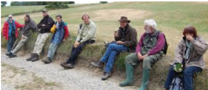
Hvile- væskepause under turen til Melbjerg Hoved