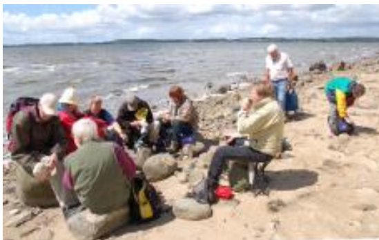
Sommeren har budt på mange gode sten-ture.