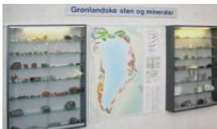
Udstilling i Det Grønlandske Hus