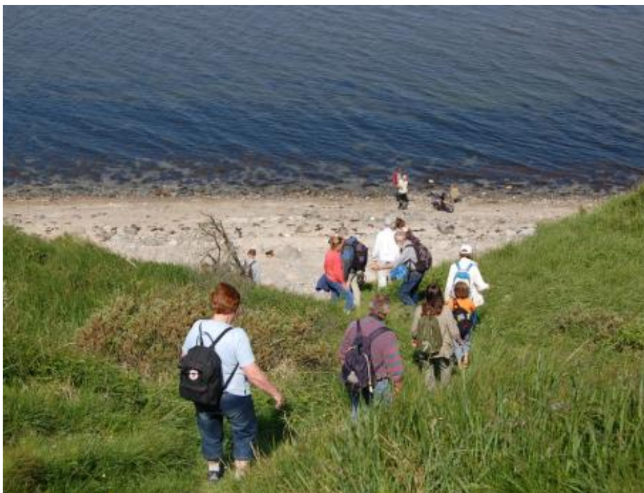
Brat nedstigning ved Louisedalen på Livo