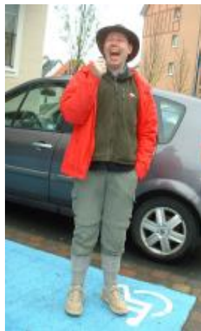
Formanden efter et godt fossil-fund