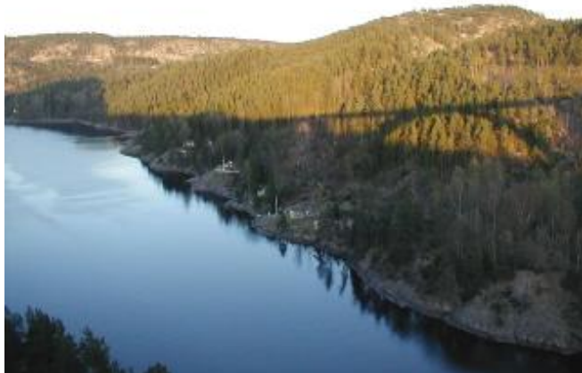
Fra tidligere Norges-tur