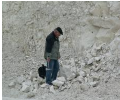
Tidligere tur til Rørdal

Også i år skal vi lige nå en fossiltur til kridtgraven i Rørdal. Det er altid en fornøjelse at komme der, og der blive næsten altid gjort fine fund. Vær opmærksom på at det er lidt sent på året, så vi kan godt risikere at vejret driller lidt, men vi kan jo klæde os på efter forholdene.