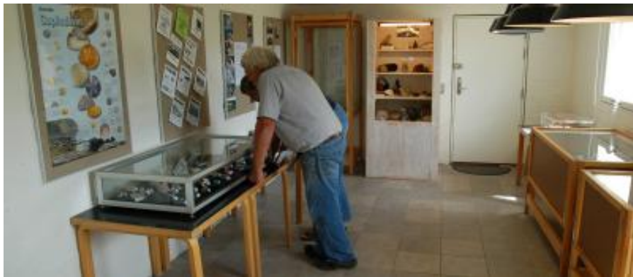
Udstilling på Strandfogedgården i Rubjerg