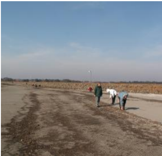
Ravsamling efter generalforsamlingen