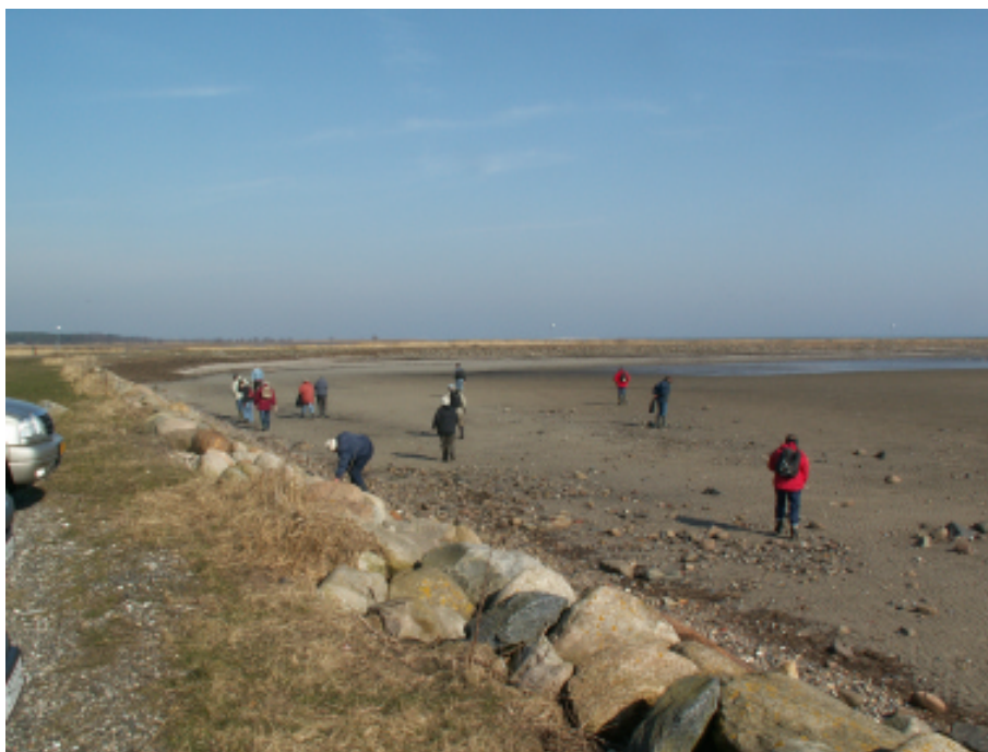
Ravsamling ved Aså efter generalforsamlingen