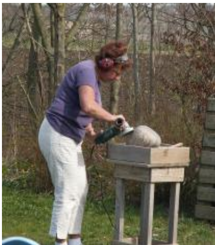
Koncentration med vinkelsliberen