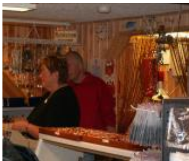
Hos Ravsliberen i Sæby